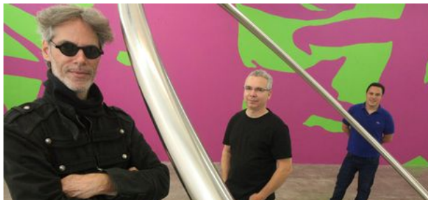
Fotografías, esculturas e instalaciones componen la muestra que cerrará el año en Espacio Monitor