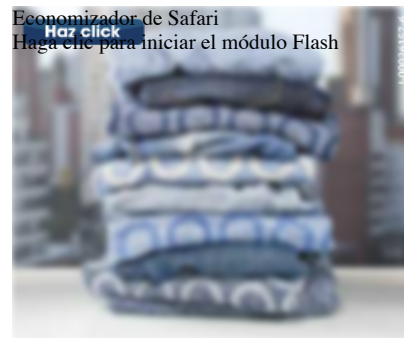
Economizador de Safari. Haga clic para iniciar el módulo Flash

Arturo Herrera creó el mural Victoria , que ocupa toda una pared. En magenta y verde establece un diálogo entre el interior de la sala y el jardín del Centro de Arte Los Galpones. En la pintura, las formas confunden su apariencia entre lo orgánico y lo abstracto.